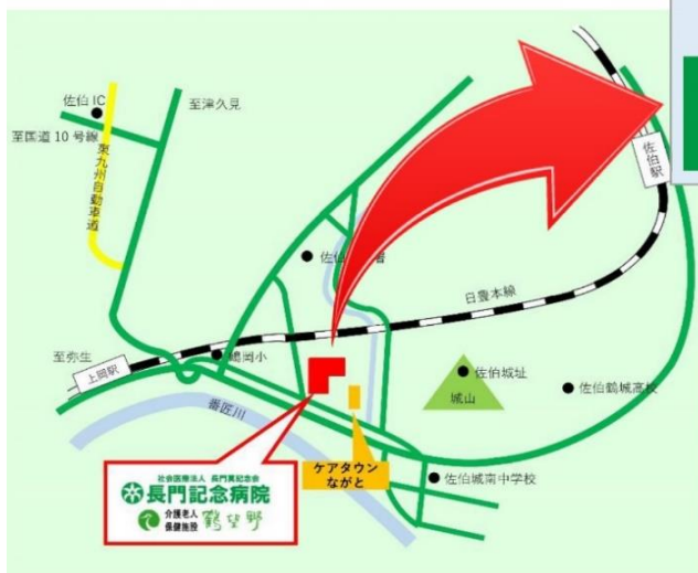
医師会PCRセンター 地図